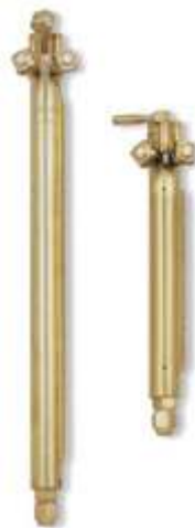
98-6 Three Hose Torches:

Inyector de presión universal para máximo ahorro Cabeza de latón Capacidad de corte hasta 380m/m